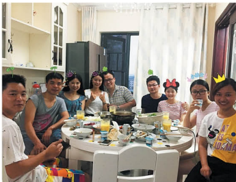
В первый день Нового года в Китае принято ходить в гости.

До изобретения хлопушек и петард шумели тем, что оказалось под рукой. В ход шли предметы домашней утвари. В 14 веке появился обычай сжигать в печи бамбуковые палочки, которые издавали сильный треск при сгорании.