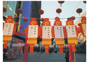
К празднику украшают улицы символами Нового года.